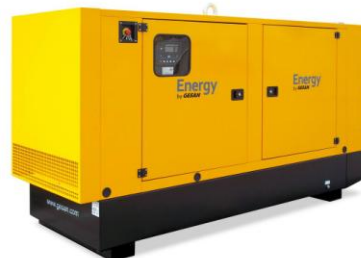
Модель кожухного исполнения