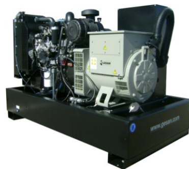
Модель открытого исполнения