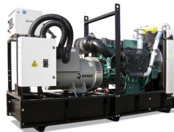
Модель открытого исполнения