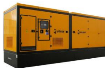
Модель кожухного исполнения

Для уточнения Длительной мощности - COP (ISO 8528/1:2005) консультируйтесь у вашего дилера GESAN