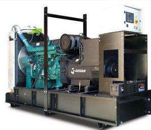
Модель открытого исполнения