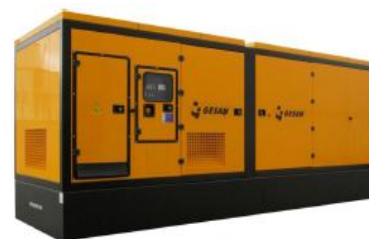
Модель кожухного исполнения

Для уточнения Длительной мощности - COP (ISO 8528/1:2005) консультируйтесь у вашего дилера GESAN