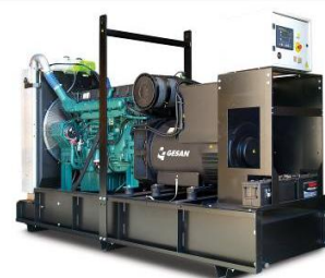
Модель открытого исполнения