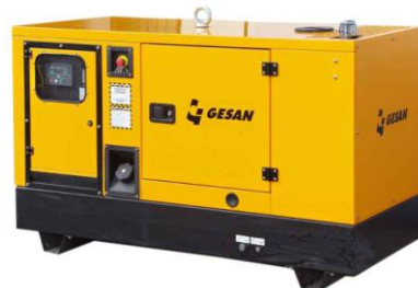
Модель кожухного исполнения

Для уточнения Длительной мощности - COP (ISO 8528/1:2005) проконсультируйтесь у вашего дилера GESAN