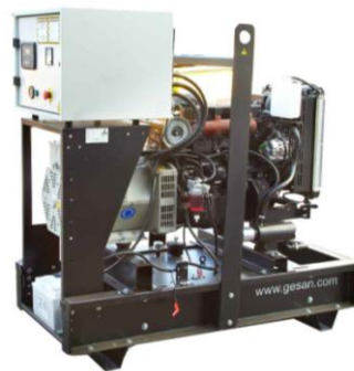
Модель открытого исполнения