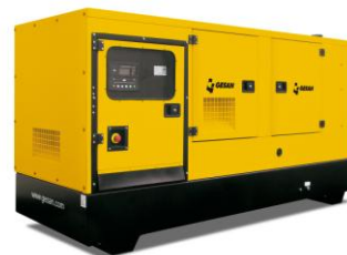
Модель кожухного исполнения